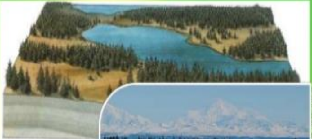
Imagem aérea extraída de DDP, Brian Johnson e outros: 100 Parks, Matos (2011).